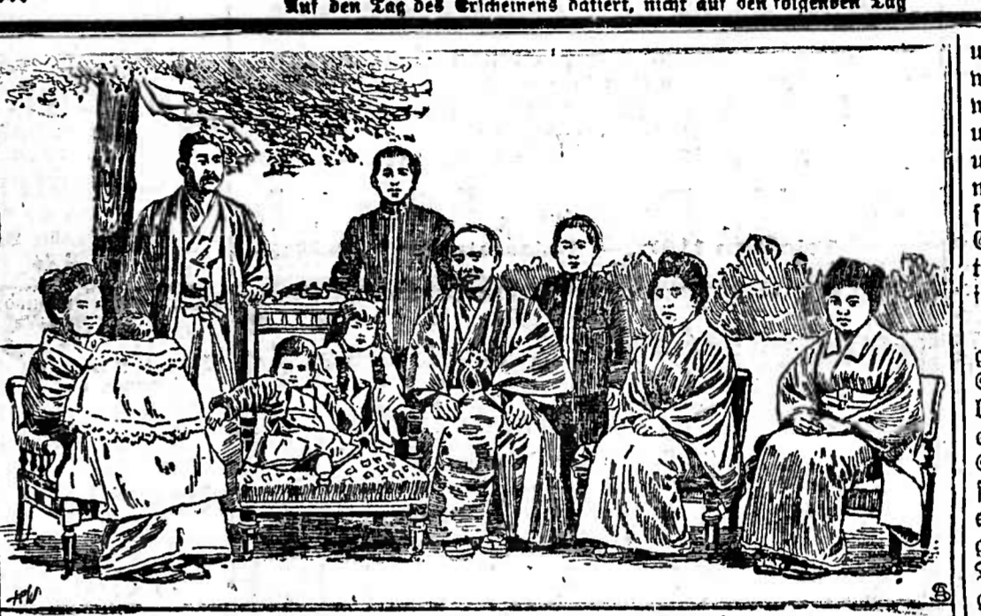
General Kuroki im Kreise seiner Familie