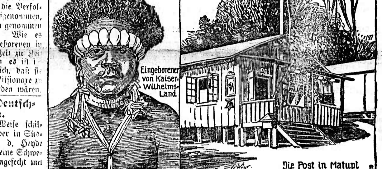
Eingeborener von Kaiser-Wilhelms-Land.