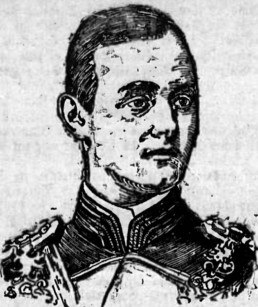
Herzog Paul Friedrich zu Mecklenburg.