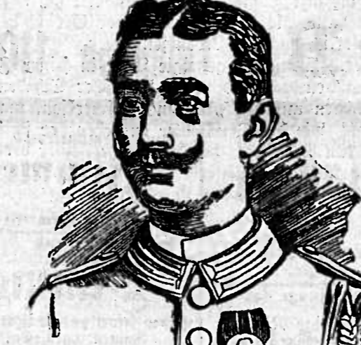
Oberleutnant v. Gifford (gestorben in dem Gefecht bei Oganjira am 9. April.)